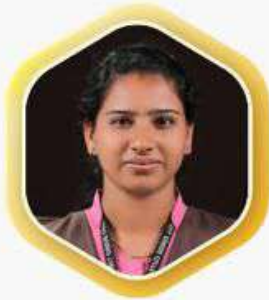
ಚುಭಲಕ್ಕೀ ಪೂಜಾರಿ ಬಿ.ಬಿ.ಎ. 2ನೇ ರ‍್ಯಾಂಕ್